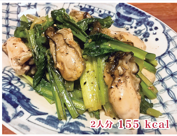
2人分 155 kcal